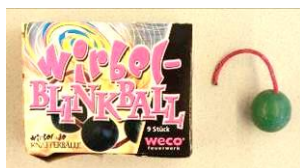
Rauch- und Blitzkugeln